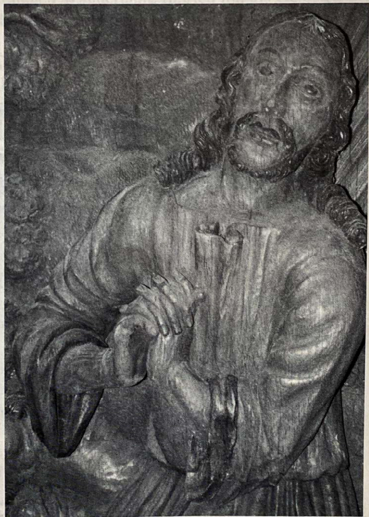
Ausschnitt aus der Ölbergszene in der St. Anna-Kirche in Twistringen (ehemals in der Lameyerschen Kapelle)

Nach der Familienüberlieferung ist bei dieser Gelegenheit aus der alten Kirche in Dinklage eine große holzgeschnitzte Ölbergszene nach Twistringen gelangt. Zunächst fand sie wieder Aufstellung in einer um 1885 abgebrochenen Kapelle auf dem Marktplatz. Danach verstaubte sie unbeachtet auf einem Speicher und wurde dann nach dem 1. Weltkrieg als Erinnerungsmal an die Gefallenen an der Außenwand der Twistringer Pfarrkirche gegenüber dem Eingang zum Pastorat aufgestellt. Dort mußte sie 1964 dem Erweiterungsbau der Kirche weichen. Das Kunstwerk wird zur Zeit restauriert und wird in der neuen St. Anna-Kirche einen würdigen Platz erhalten.